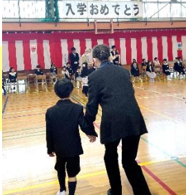
入学式お世話ボランティア