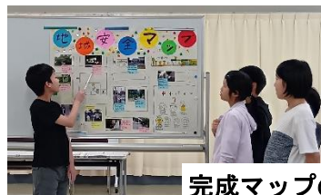
完成マップの発表会