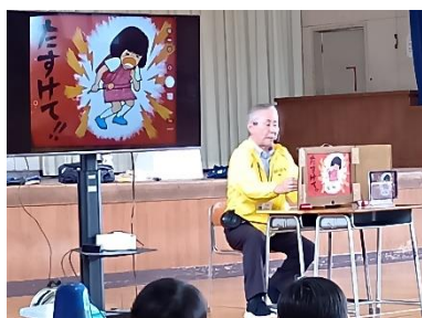
紙しばいで防犯講話

登下校時に不審者に会ったときを想定し、身を守る方法を学びました。大声を出して叫んだり、ランドセルを投げ捨てて走ったり、不審者役の大人から逃げ、必死に助けを求める姿があり、緊迫感のある訓練になりました。