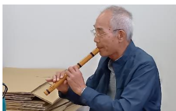
「ケーナ」を吹いてくれました