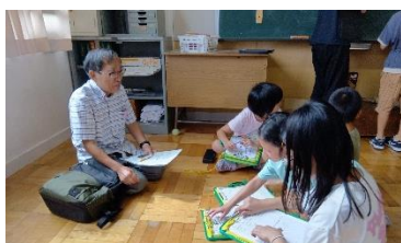
地域の方へインタビュー

7月に続き、2回目となる地域の皆さんとの交流学习。14名の方にご協力いただきました。「今楽しんでいることは何ですか？」のインタビューには、趣味の手作り品や珍しい楽器を見せていただき、楽しいお話をたくさん聞かせていただきました。