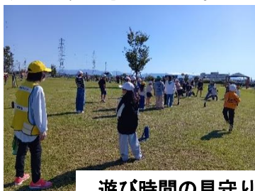
遊び時間の見守り