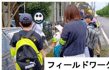
フィールドワーク

防犯の視点から自分たちの暮らす地域を見てまわり、安全な場所・危険な場所について学び、マップにまとめる活動です。