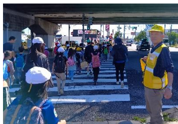
交通安全の見守り

今年もボランティアさんの交通安全の見守りのおかげで安全に歩いて行くことができました。公園でのトイレや遊びの安全見守り活動も大変お世話になりました。ありがとうございました。