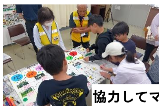
協力してマップ作成

座学で学んだ、『見えやすく入りにくい』（安全）、『見えにくく入りやすい』（危険）をポイントに、実際に自分たちの足で歩き、写真を撮ったり、街の人にインタビューをしたりした内容をもとに、立派なマップを作り上げてくれました。完成した作品はこれからコンテストに出品されます。