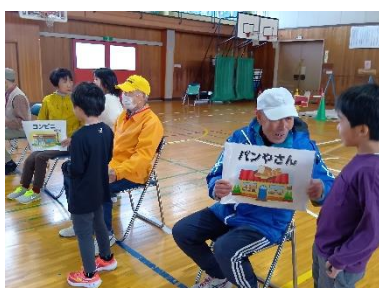
走ってお店に逃げ込みました